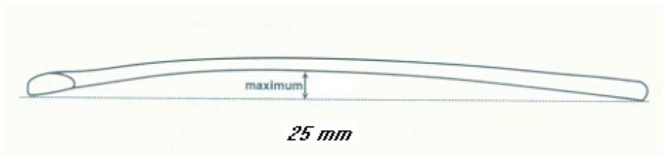
Figura 5: Curvatura del Stick

La inclinación o arco se comprueba con una cuña puntiaguda de 25mm. desde su base hasta su punta o también con un cilindro de 25mm.de diámetro. El stick se coloca plano sobre una superficie llana. La cuña se coloca con su base sobre la superficie. El cilindro se desliza a lo largo sobre la superficie. Ni la cuña ni el cilindro pueden pasar completamente por debajo del stick en ningún punto a lo largo de toda su longitud